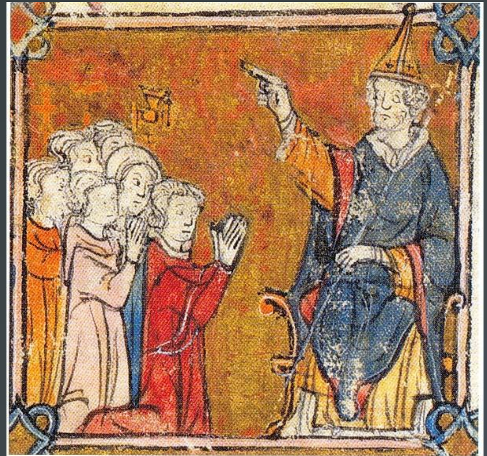
Papst Urban II. predigt den Kreuzzug, Buchmalerei 14. Jhd.